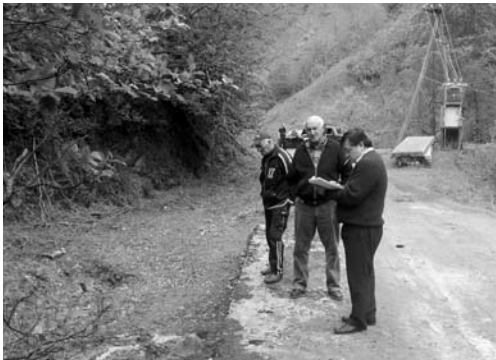
ჩატარდა მოსახლეობის საერთო კრებები