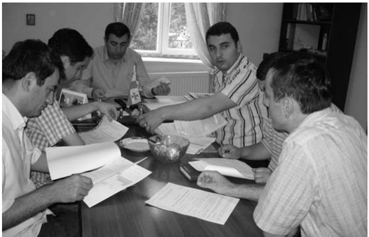
სამუშაო შეხვედრები გაიმართა ადგილობრივი თვითმმართველობების ორგანოებში

რაც შეეხება შედეგებს, შემიძლია პასუხი ორი ფორმით ჩამოვყავალი. მე ძალიან მომეწონა შუაბევის მუნიციპალიტეტში, პროექტის ფარგლებში შემუშავებული მიზნობრივი პროგრამების საჯარო განხილვის დროს, ერთ-ერთი თემის რწმუნებულის მიერ ჩამოყალიბებული ლაკონური და ამავე დროს ზუსტი შეფასება პროექტის შედეგებსა – „მოხუცდავად იმისა, გამოყენილი პრობლემების გადაწყვეტა დაფინანსდება თუ არა, უნდა იყოს მიღწეული არის ის, რომ მოსახლეობამ ისინი ახლა თუ როგორ გამოკვეთის პრობლემები, განსაზღვრის პრიორიტეტები და როგორი ფორმით უნდა მოხდეს ამგებობა ინფორმაციის მიწოდება“. ეს შეფასება ნაილად გვიჩვენებს მივალნით თუ არა მიზანს. პროექტის ერთ-ერთი მთავარი ამოცა-