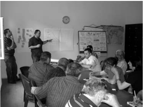
ჩატარდა მოსახლეობის საერთო კრებები