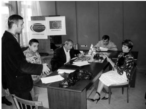
საინიციატივო ჯგუფის წევრებს ტრენინგები ჩატარდა

მთლიანობაში, ადგილობრივი თვითმმართველობის ორგანოებთან თანამშრომლობის ფორმების თანდათანობითი იხვეწება და ღრმავდება. ჩვენი სამომავლო პროექტებიც სწორედ თანამშრომლობაზეა დაფუძნებული.